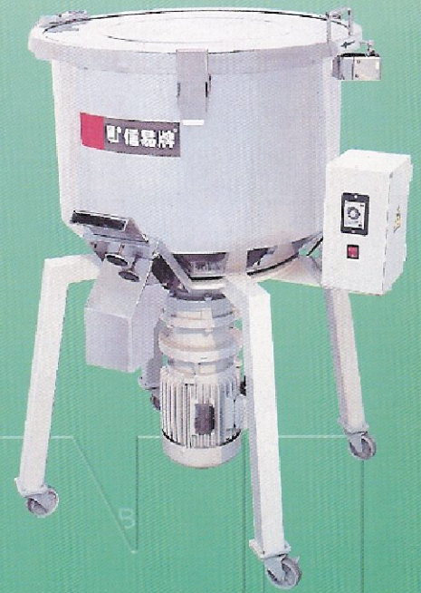
SVM-50 立式拌料機 Vertical mixer