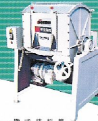
SHM-100 橫式拌料機 Horizontal mixer