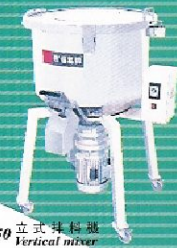
SVM-50 立式拌料機 Vertical mixer