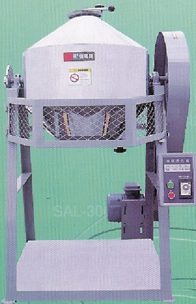
吸料 SRM-50 滾桶式拌料機 Rotating mixer