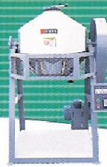
SRM-50 滾桶式拌料機 Rotating mixer